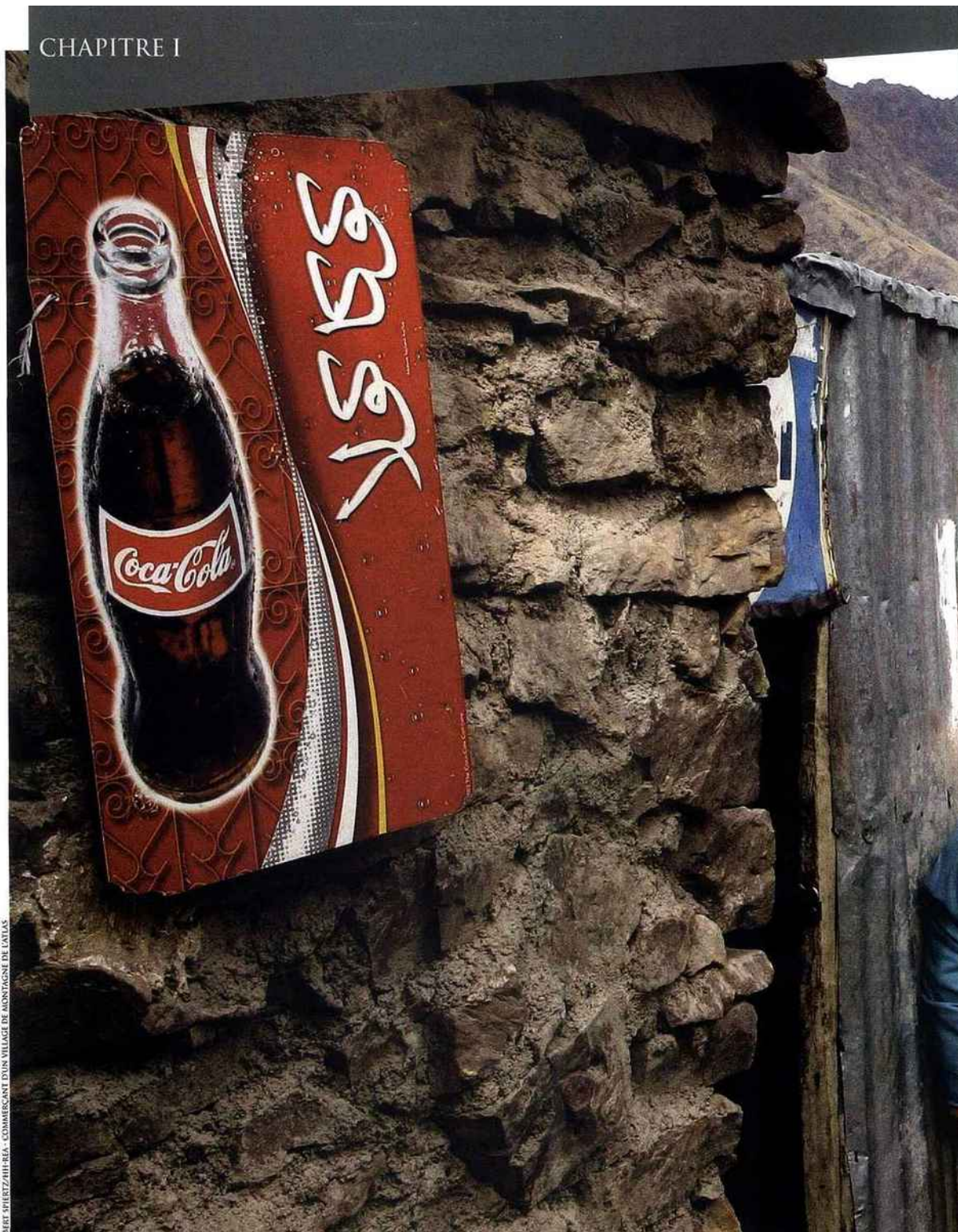
BEET WHERTZ/ATH-REA - COMMERCEANT D'UN VILLAGE DE MONTAGNE DE L'ATLAS